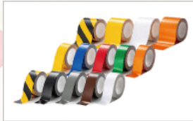
耐久性が高く糊残りがしづらい ラインテープ