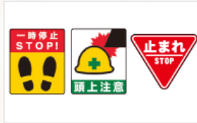
安全対策用のデザインシート